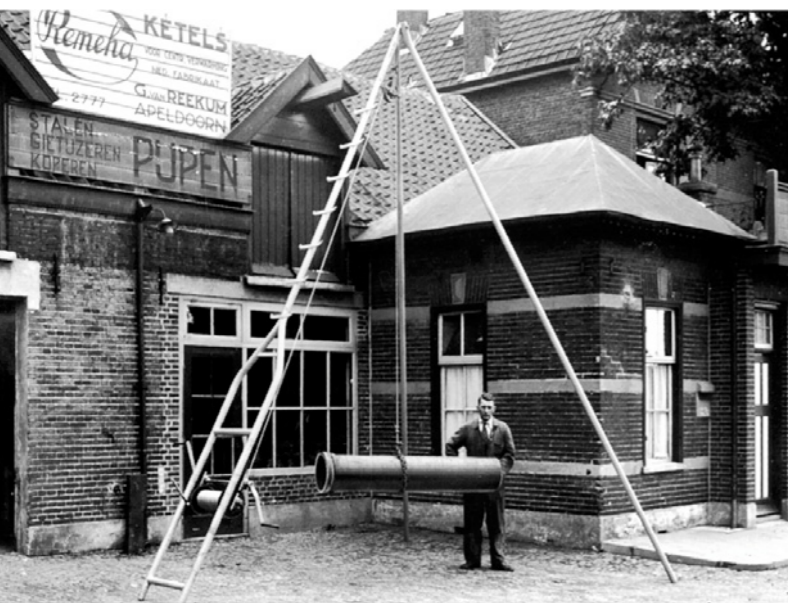
A kondenzációs kazántechnika