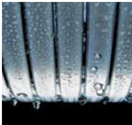
Inox-Radial hőcserélő saválló nemesacélból

A Vitodens 100-W kondenzációs falikazán minden lakás és családi ház számára ideális választás. Probléma nélkül elhelyezhető akár egy fürdőszoba, vagy háztartási helyiség falmélyedésébe. A Vitodens 100-W akár mosógép, vagy szárítógép fölé is szerelhető.