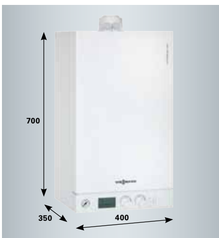
Minimális befoglaló méreteivel és csendes üzemével alkalmas a lakótérben történő felállításra