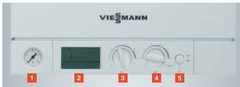
Digitális szabályozó, integrált diagnosztikai funkciókkal

Mind a karbantartás, mind a szerelés során a Vitodens 100-W kondenzációs falikazán rendkívül időtakarékos. Minden részegység előlről hozzáférhető, oldaltávolság tartása nem szükséges. Az összes gépészeti részegység, mint a fűtési szivattyú, a melegvíz váltószelep, a tágulási tartály, a készülék burkolata alatt helyezkedik el, és gyárilag beállításra került.